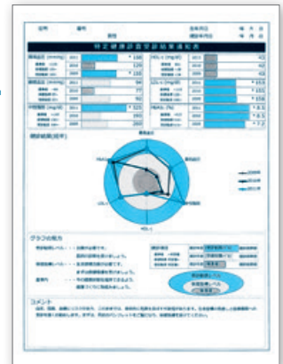
※「特定健康診査受診結果表」イメージ図

特定保健指導は、ご自身の生活習慣を見直していただく「きっかけ」となりますので、特定保健指導利用券を受け取られましたら、この機会に是非ご利用ください。