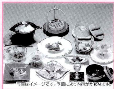
写真はイメージです。季節により内容がかわります。