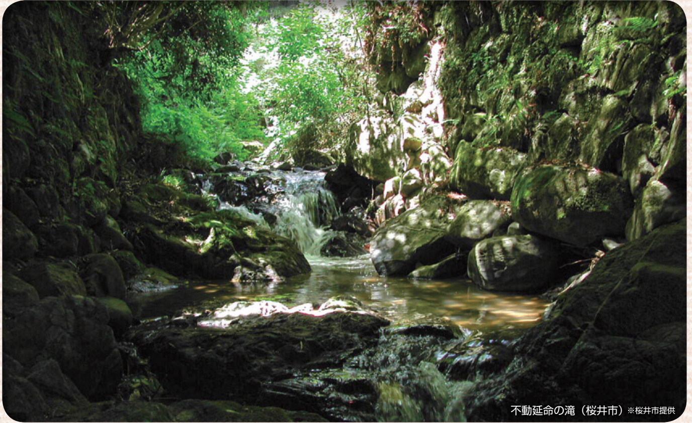
不動延命の滝（桜井市）