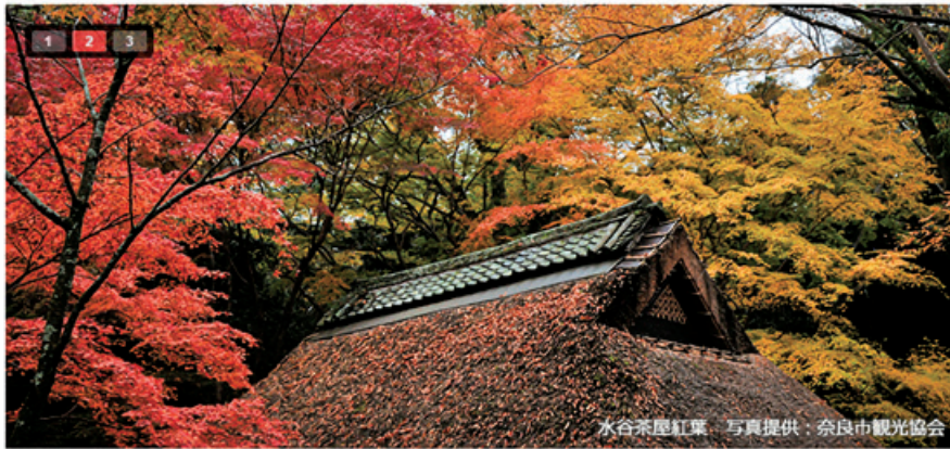
水谷茶屋紅葉