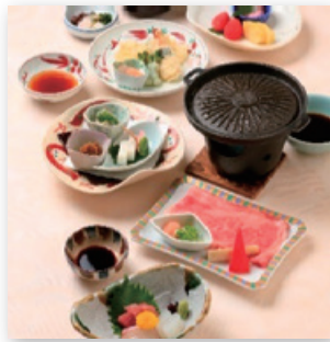
*料理写真はイメージです。

お申込み時に「奈良県市町村職員共済組合 組合員」とお伝えいただき、当日「組合員証」「宿泊利用助成券」をご提示ください。