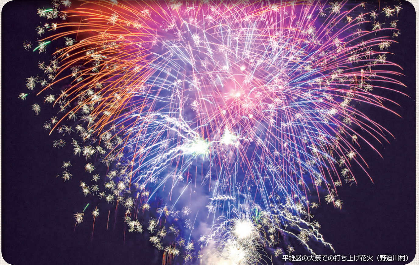
平維盛の大祭での打ち上げ花火（野迫川村）