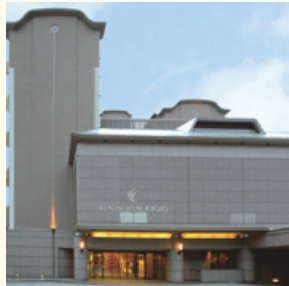
HOTEL CENTNOVUM KYOTO ホテル セントノーム京都

レストラン「フローラ」 写真は『スペシャルランチ』 肉料理、魚料理が楽しめる豪華なランチです。 京料理「山水」 写真は『御所弁当』 季節感あふれる料理はどれも上品な味わいです。 ※17:00～はサービス料10%を申し受けます。