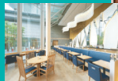
レストラン「ジャルダン」