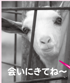
信貴山のどか村のトカラヤギ

のどかな緑あふれる日本最大級の花菖蒲園やベゴニア、洋ランなどが大温室で観賞できます。また、イモ堀り、リンゴ狩りなどの体験もでき、木工教室、陶芸教室も催されています。季節の鉢花の販売も1年中行なっています。