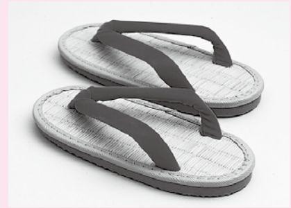
健康履きミサトツ子

日本独自の生活様式から生まれた履物「ぞうり」は当時の産業として支えられてきました。特に鼻緒の生産は全国シェアの8割を占めたときもありました。しかし、時の移り変わりとともに「ぞうり」から「靴」へと変わり、廃業する生産者もいました。そんな中に、当時の長年培った技術と職人根性、熱意と経験により新製品「健康履きミサトツ子」が誕生。子供たちの扁平足、外反母趾といった足の異変の解消に効果があると研究データが実証しています。天然のい草を使った感触バツグンの履物に全国から問い合わせが殺到しているようです。